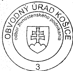
Ing. Alena Vaisová vedúca odboru

Osvedčenie o živnostenskom oprávnení je vydané podľa § 47 ods. 4 v spojení s § 10 ods. 4 a § 66b ods. 1 zákona č. 455/1991 Zb. o živnostenskom podnikaní (živnostenský zákon) v znení neskorších predpisov.